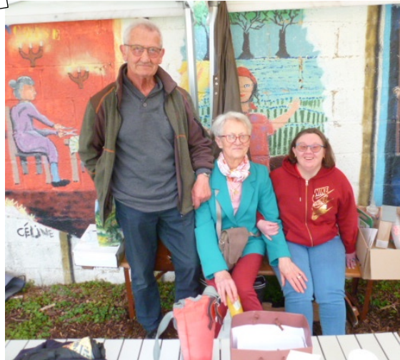
Toutes et tous sourires aux lèvres